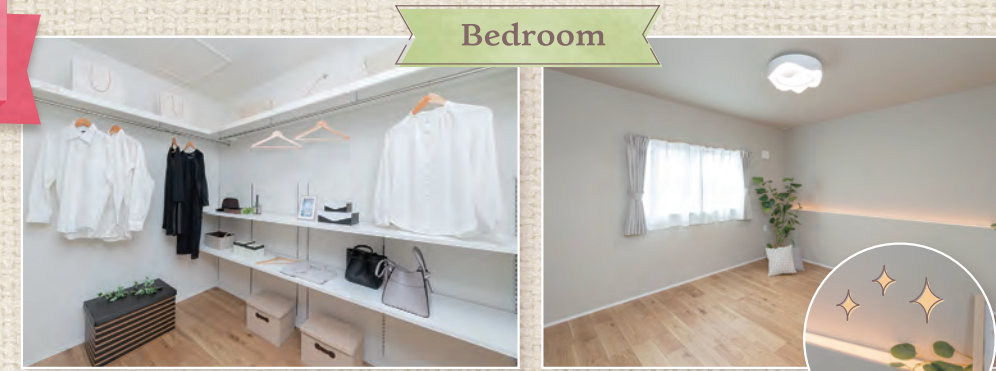
やさしい間接照明とWICのある主寝室!