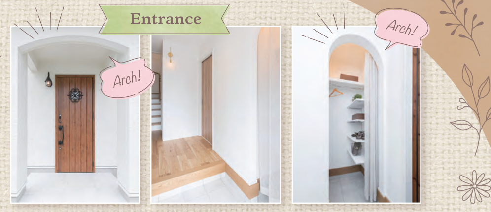
玄関には使い勝手の良いアーチ壁の土間収納。帰宅後すぐに物を置いて便利!

お施様のご厚意で入居前の住宅をご覧ください。 7/12±13日 AM10:00~PM5:00 ご来場プレゼント サーターワン『ギフト券』 ※初めてアンケートにご記入いただいた方で、弊社エリアにて住宅をお探しの方に限らせていただきます。お一家族様1つとします。数に限りがございます。ご了承ください。