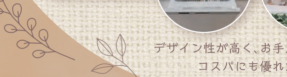
デザイン性が高く、お手入れもラク コストにも優れたキッチン