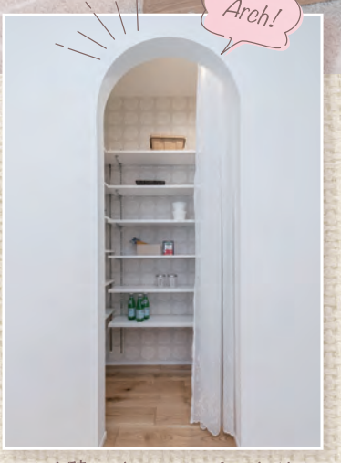
アーチ壁のオシャレパントリー