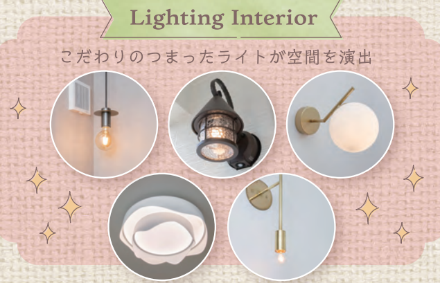
こだわりのつまったライトが空間を演出