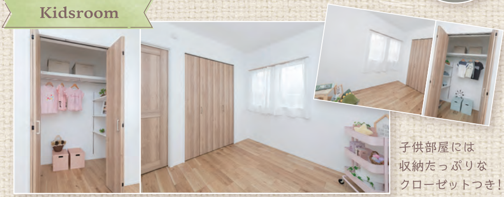
子供部屋には収納たっぷりなクローゼットつき!